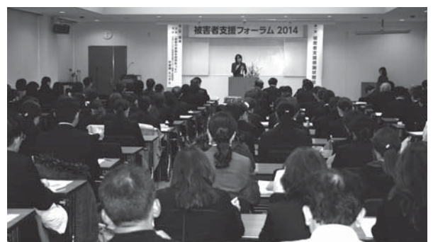
フォーラム2014の講演状況