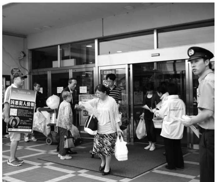
広報活動状況(ラパーク金沢店)