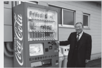
被害者支援自販機(株)日本美装

(学)金沢工業大学 手取フィッシュランド (株)サリック (株)日本美装 ドライビングスクールエクシール城東 (学)アリス国際学園 (株)加茂野自動車 輪島市マリンタウン陸上競技場 石川県立看護大学 シダックスアイ松原病院 (株)昭和住宅 石川県立大学 石川県警察学校 石川県警察機動隊 (株)小松製作所粟津工場 石川近鉄タクシー(株) (株)日野ヒューテック ジェイバス(株) (株)ピーニングホールディングス コマツ石川(株) (株)エムアンドケイ (有)べんりやさん 美漢方爽泉「ドラッグ前田」 (株)アドマック (株)不動ジャパン (株)アース (株)国土開発センター 山成商事(株)