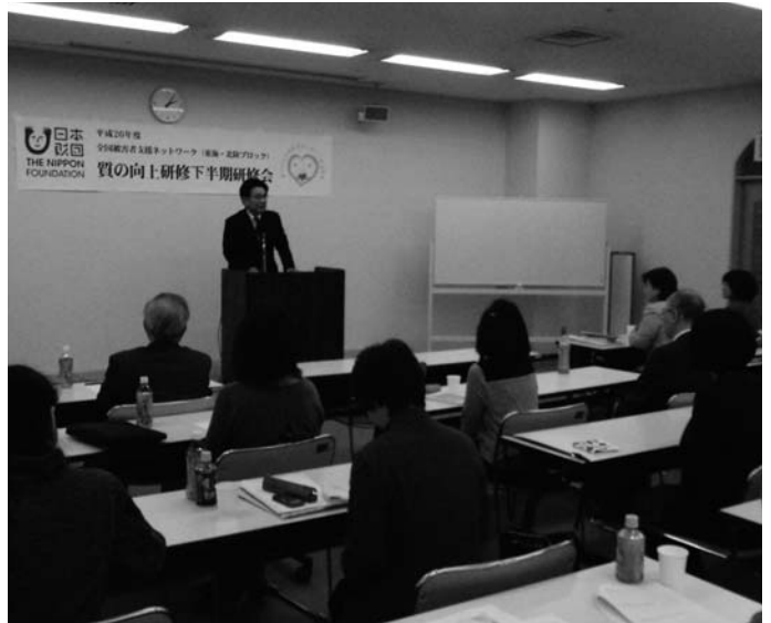
東海・北陸ブロック研修会の状況